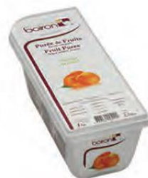
ΒΕΡΙΚΟΚΟ ΚΩΔ. 005-0020 Διαθέσιμο και σε δοχείο 10kg (ΚΩΔ. 005-0111)