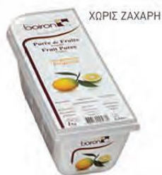
ΠΕΡΓΑΜΟΝΤΟ ΚΩΔ. 005-0090