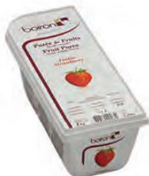
ΦΡΑΟΥΛΑ ΚΩΔ. 005-0022 Διαθέσιμο και σε δοχείο 10kg (ΚΩΔ. 005-0079)