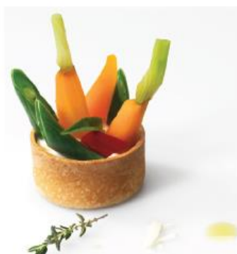
1089-0003 MINI CIRCLE

ΔΙΑΜΕΤΡΟΣ: 36mm ΎΨΟΣ: 17,5mm ΚΙΒΩΤΙΟ ΜΕ 96 ΤΜΧ.