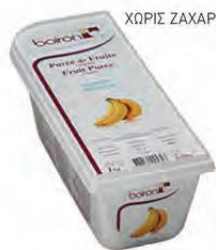
ΜΠΑΝΑΝΑ ΚΩΔ. 005-0028