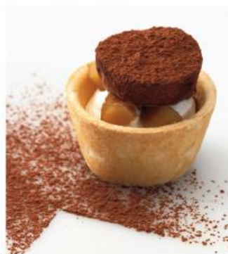
1089-0001 MINI CUP

ΔΙΑΜΕΤΡΟΣ: 40mm ΔΙΑΜΕΤΡΟΣ ΒΑΣΗΣ: 31mm ΎΨΟΣ: 22mm ΚΙΒΩΤΙΟ ΜΕ 96 ΤΜΧ.