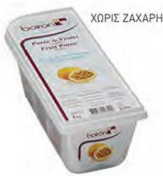
ΦΡΟΥΤΑ ΤΟΥ ΠΑΘΟΥΣ ΚΩΔ. 005-0026