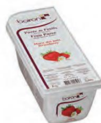
ΦΡΑΟΥΛΑ «ΜΑΡΑ» ΤΟΥ ΔΑΣΟΥΣ ΚΩΔ. Κ.Π.