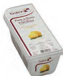
ΛΕΜΟΝΙ ΚΩΔ. 005-0027 Διαθέσιμο και σε δοχείο 10kg (ΚΩΔ. 005-0056)