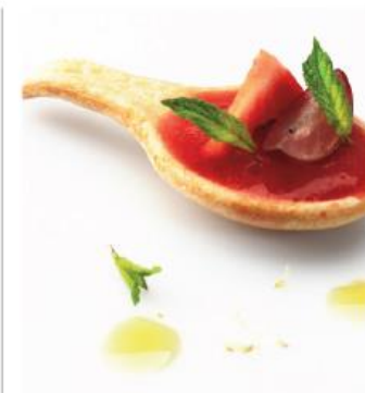
1089-0008 MINI SPOON