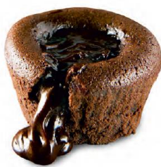
1127-0001 Lava Cake Σοκολάτα

Ακαταμάχητα σοκολατένια σέμα με καρδιά από όπου ρέει η λακωνιστή γέμιση σε τρεις εκδόσεις, η μία καλύτερη από την άλλη: σοκολάτα, βατόμουρο, αστάρι. Με λίγα λεπτά ζέσταμα θα λιώνει για εσάς.