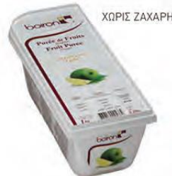
ΠΡΑΣΙΝΟ ΛΕΜΟΝΙ (LIME) ΚΩΔ. 005-0034 Διαθέσιμο και σε δοχείο 10kg (ΚΩΔ. 005-0114)