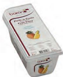
ΑΝΑΝΑΣ ΚΩΔ. 005-0045 Διαθέσιμο και σε δοχείο 10kg (ΚΩΔ. 005-0072)