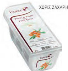
ΙΠΠΟΦΑΕΣ ΚΩΔ. 005-0119