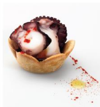
1089-0009 MINI FLOWER

ΔΙΑΜΕΤΡΟΣ: 42mm ΎΨΟΣ: 18mm ΚΙΒΩΤΙΟ ΜΕ 96 ΤΜΧ.