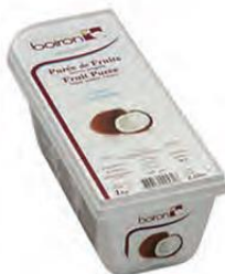
ΚΑΡΥΔΑ ΚΩΔ. 005-0029 Διαθέσιμο και σε δοχείο 10kg (ΚΩΔ. 005-0101)