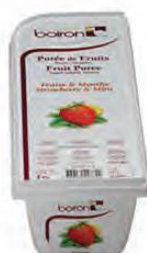
ΦΡΑΟΥΛΑ & ΜΕΝΤΑ ΚΩΔ. 005-0064