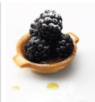
1089-0005 MINI CASSEROLE

ΔΙΑΜΕΤΡΟΣ: 58mm ΎΨΟΣ: 15mm ΚΙΒΩΤΙΟ ΜΕ 96 ΤΜΧ.