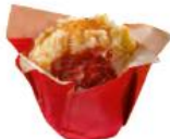
Μini Μuffin με φρούτα του δάσους