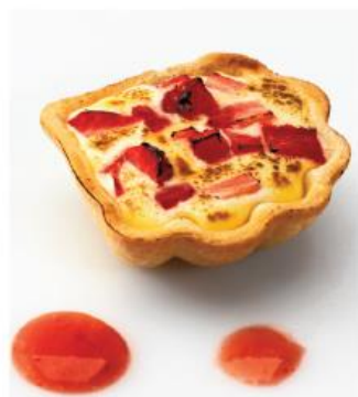
1089-0006 MINI SCALLOP SHELLS

ΔΙΑΜΕΤΡΟΣ: 52mm ΎΨΟΣ: 15mm ΚΙΒΩΤΙΟ ΜΕ 96 ΤΜΧ.