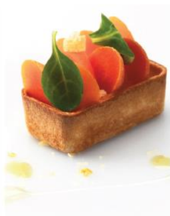
1089-0004 MINI BULLION

ΔΙΑΜΕΤΡΟΣ: 48x26mm ΎΨΟΣ: 14mm ΚΙΒΩΤΙΟ ΜΕ 96 ΤΜΧ.