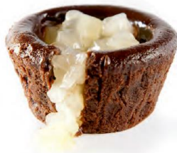
1127-0002 Lava Cake Αστάρι