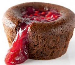
1127-0003 Lava Cake Βατόμουρο